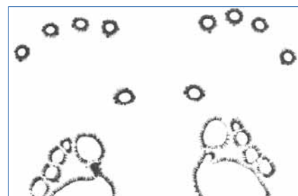
Abb. 3: ETD – Energetische Terminalpunktdiagnose

Die Antwort darauf ist auch die Begründung dafür, dass mir dieser Artikel so ungewöhnlich großes Kopfzerbrechen bereitet hat, wie mir das – vielleicht mal abgesehen von dem mit ansatzweise ähnlichen Herausforderungen