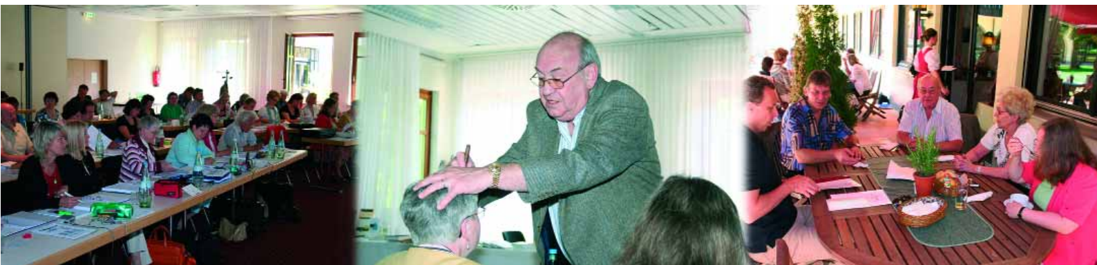
Abb. 4: Seminar-Atmosphäre

Internationales Mandel-Institut für Esogetische Medizin Esogetics GmbH Hildastraße 8, D-76646 Bruchsal Tel.: 07251 / 80010 www.esogetics.com